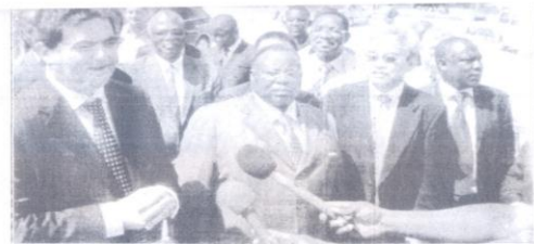
Le ministre Kpabré-Sylli : « nous apprécions à sa juste valeur ce projet qui renforcera notre capacité d'hébergement ».