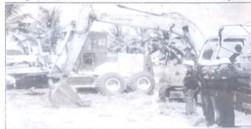
Bulldozers et autres engins en pleine activité à l'issue de la cérémonie.