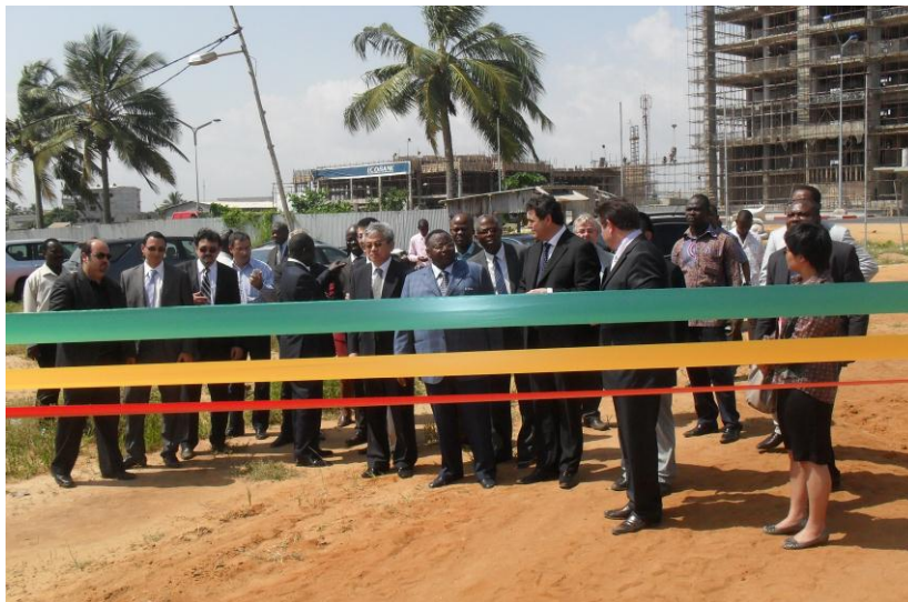
Photo de l'évènement

Artículo del diario Togo Presse del 26 de noviembre en la página siguiente: « Bientôt un hôtel 5 étoiles haut standing du groupe PEFACO sur la côte de Lomé ».