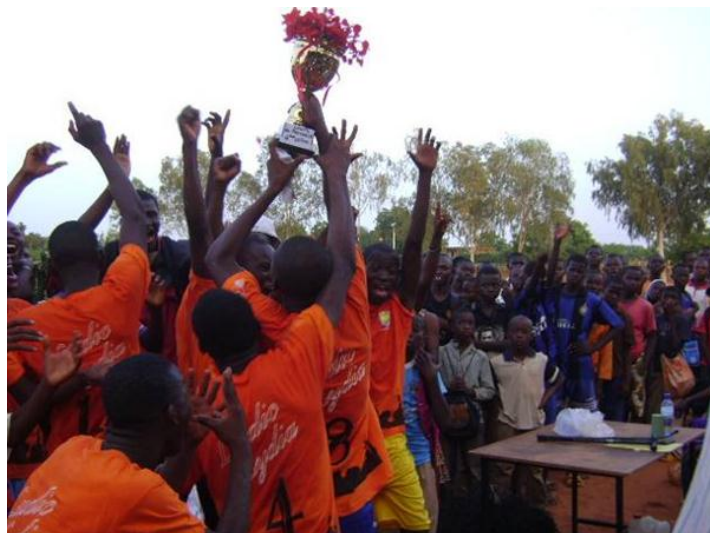
Los ganadores celebrando la victoria

Artículo del diario L'Observateur Paalga del 9 de junio 2011 en la página siguiente: « La 1 re DI succède à la 2 nde C1 ».