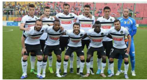
L'ES Sétifiennne a tenu en échec l'Etoile du Congo au stade Alphonse-Massamba-Débat

Le Wydad athlétique club de Casablanca a connu la même réussite face à Cnaps sport football de Madagascar (5-1). Zesco United de la Zambie a dominé Horoya FC de la Guinée 4-1. LUS Douala s'est inclinée à domicile face au Zamalek d'Egypte 0-1. Kaizer Chiefs d'Afrique du sud est tombé sur ses propres installations devant Asec Mimosas de la Côte d'Ivoire 0-1. Warri Wolves du Nigeria a été battu à domicile par El Merreikh du Soudan sur ce score identique. APR FC du Rwanda s'est incliné à Kigali 1-2 devant Young Africans de la Tanzanie. Vita club de Kinshasa a pris le meilleur devant Club Ferroviario de Maputo 1-0. Le Stade Malien a dominé Coton sport de Garoua 2-0. Mamelodi Sundowns d'Afrique du sud a fait autant devant l'AC Léopards de Dolisie. Le Club africain de Tunis a eu raison de Mouloudia Olympic Bejaia 1-0. Al Ahly Tripoli s'est imposé face à El Hilal du Soudan 1-0. L'Etoile du Congo a été accroché par l'Entente sportive Sétifiennne d'Algérie 1-1. Olympique de Khouribga et l'Etoile