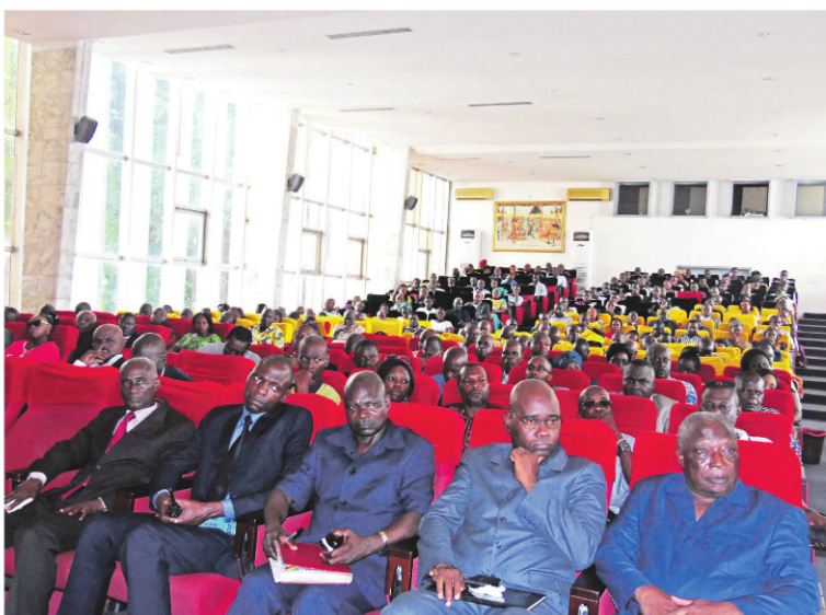
Une vue des observateurs nationaux