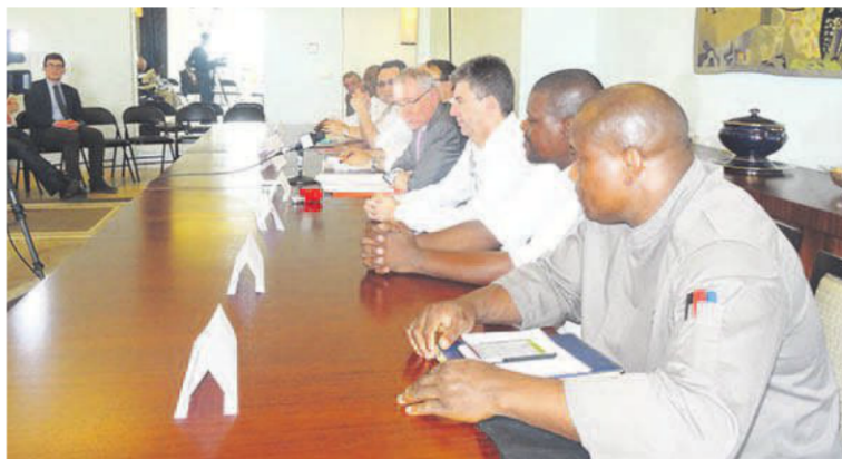
L'ambassadeur de France au Congo, encadré par les responsables des différents restaurants de la place.

Chaque chef proposera un menu à la française dans son restaurant tout en restant libre de mettre en avant ses propres traditions et pratiques culinaires. Dans